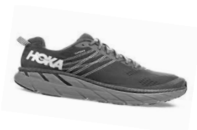
"HOKA CLIFTON 6 "

In entrambi le modalità con la ricevuta di pagamento riceverai un coupon di euro 40 da spendere al momento dell'acquisto di un paio di scarpe da running di marca "HOKA" modello .